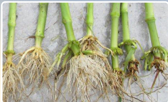
Danno da diabrotica su piante non trattate