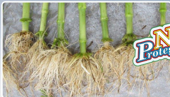
Sviluppo radicale di piante trattate con Diastar Maxi